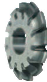
NR. 1: 12-13 ZÄHNE / TEETH / DENTI